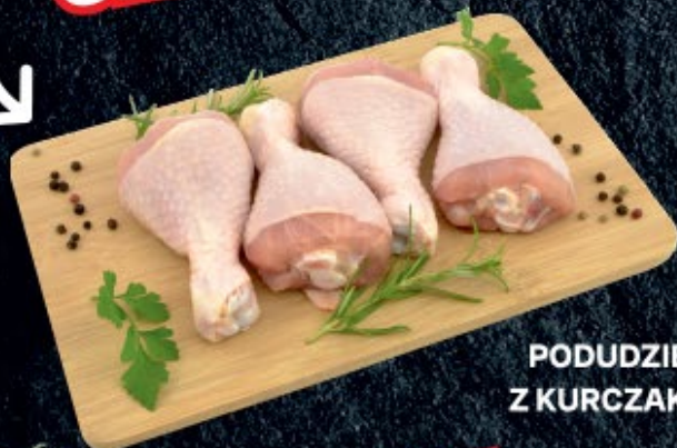
PODUDZIE Z KURCZAKA